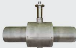
Unterflurhähne mit gelagerter Kugel nach EN 488:2015