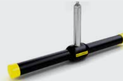
Unterflurhähne mit schwimmender Kugel nach EN 488:2015