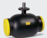
DN50-400 Konstruktion mit schwimmender Kugel und vollem Durchgang