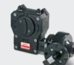
Broen Getriebe mit Winkelvorgelege