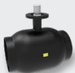
DN200-500 schwimmende Kugel reduzierter Durchgang