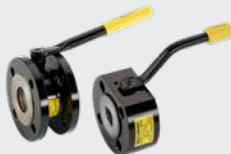
Hähne in Kurzbauforn