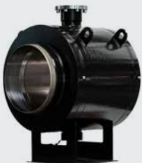
DN150-1400 doppelt gelagerte Kugelhähne