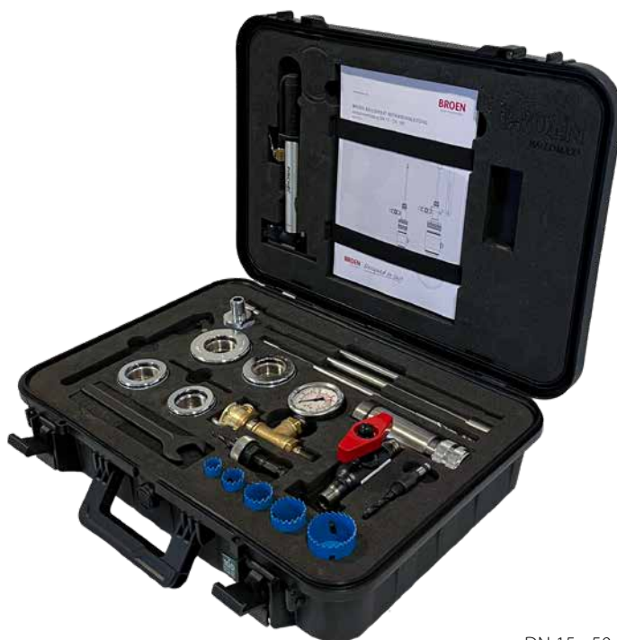
DN 15 - 50