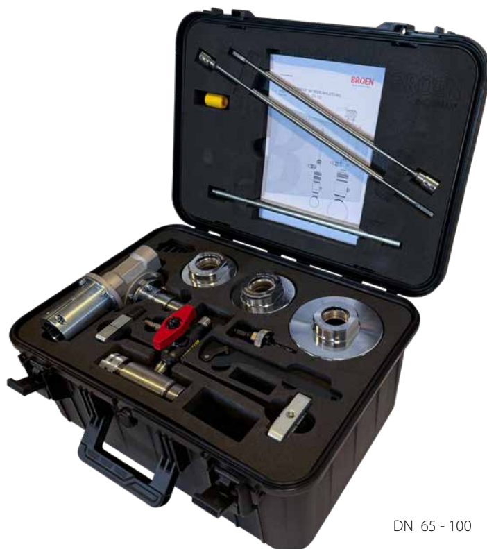
DN 65 - 100